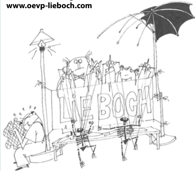
MARIONETTENTANZ UNTER GEMEINDESICHERHEITSSCHIRM

Bitte die Vorschläge senden an: www.oevp-lieboch.com