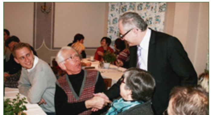
Nach dem offiziellen Teil wurde noch einige Zeit über aktuelle und kommunalpolitische Themen diskutiert.